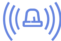
Zones à risque